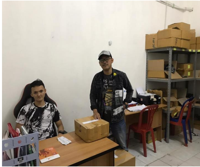
Gambar 3.4 Gudang penyimpanan Barang.