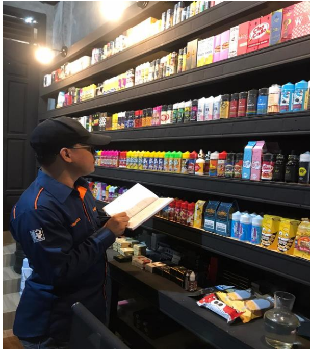
Gambar 3.8 Stock opname