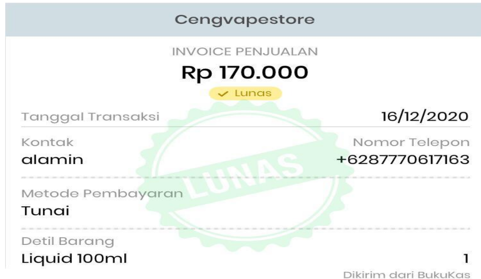
Gambar 3.3 Invoice Penjualan

Seandainya invoice penjualan sudah keluar, kita bisa langsung mencetak invoice atau mengirim invoice tersebut langsung melalui whatsapp dan email.