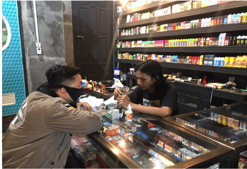
Gambar 3.5 Melayani Konsumen.