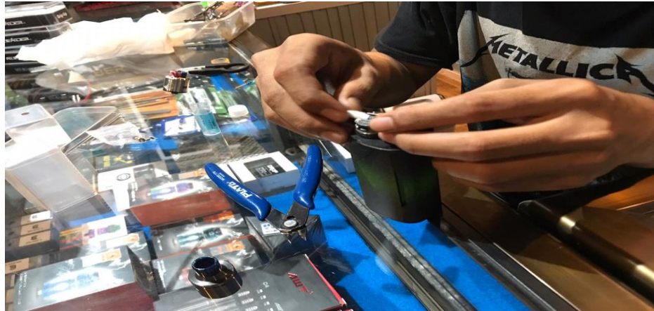
Gambar 3.6 proses coiling & wicking