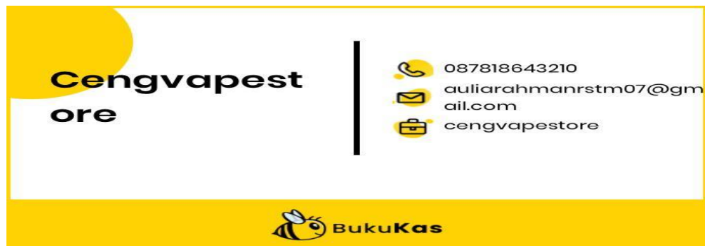
Gambar 3.1 Kartu nama pada aplikasi

besar UMKM menggunakan aplikasi ini beberapa kali setiap harinya. Sedangkan hingga April 2020, BukuKas mengklaim telah melayani lebih dari 250.000 UMKM yang telah mencatatkan transaksi senilai US$150 (setara dengan Rp2,26 triliun).