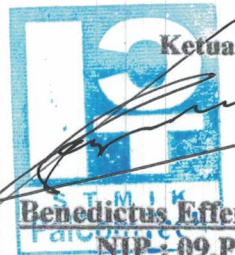
Benedictus Effendi S.T.M.T NIP : 09.PCT.13