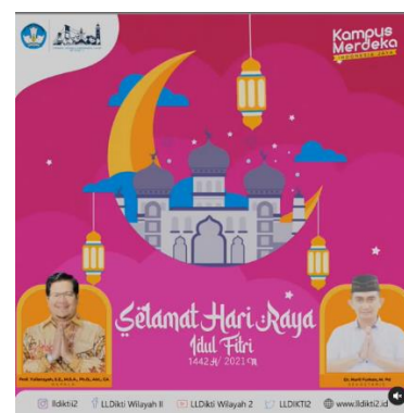
Gambar 3.7 Desain Ucapan Hari Idul Fitri