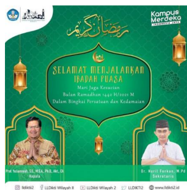
Gambar 3.4 Desain Ucapan Ibadah Puasa

Penulis diberikan tugas dari pembimbing lapangan membuat desain ucapan untuk menjalankan ibadah puasa bulan Ramadhan 1442 H/2021 M.