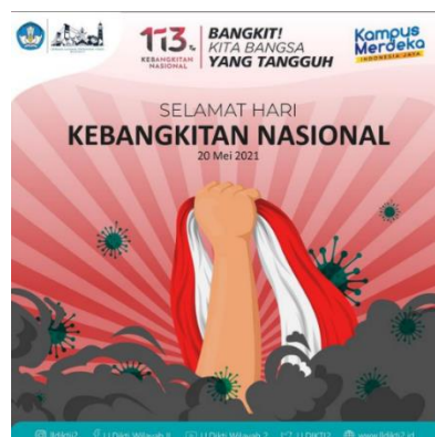
Gambar 3.9 Desain Hari Kebangkitan Nasional

Penulis diberikan tugas dari pembimbing lapangan membuat desain ucapan Selamat hari Kebangkitan Nasional dengan Tema Bangkit Bersama melawan wabah Covid-19 yang tengah melanda dunia saat ini.