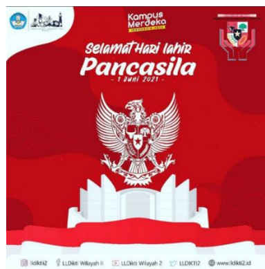
Gambar 3.11 Desain Hari Lahir Pancasila

Penulis diberikan tugas dari pembimbing lapangan membuat desain ucapan Selamat hari Lahir Pancasila yang di peringatkan pada tanggal 1 Juni 2021.