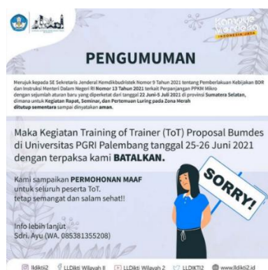
Gambar 3.14 Desain Pembatalan Kegiatan Training of Trainer

Penulis diberikan tugas untuk membuat desain pengumuman Pembatalan Kegiatan Training of Trainer (ToT) Proposal Bumdes yang akan dilaksanakan pada tanggal 25-26 Juni 2021 secara luring di Universitas PGRI Palembang kami batalkan.