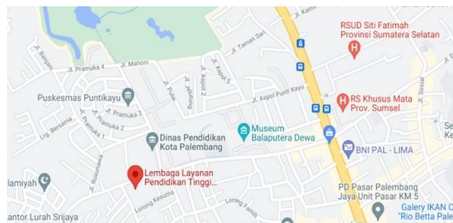
Gambar 1.1 Lokasi LLDIKTI

Lokasi Praktek Kerja Lapangan (PKL) berlokasi di Jl. Srijaya No.883, Srijaya, Kec. Alang-Alang Lebar, Kota Palembang, di sebuah Lembaga Layanan Pendidikan Tinggi Wilayah II.