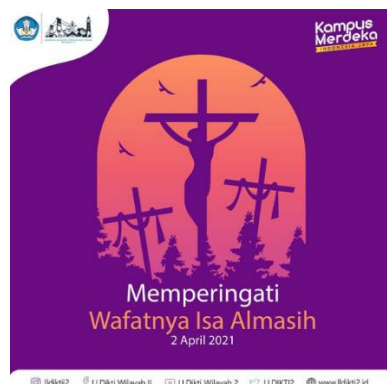
Gambar 3.2 Desain wafatnya Isa Almasih

Penulis diberikan tugas dari pembimbing membuat desain memperingati wafatnya Isa Almasih yang jatuh pada hari Jumat agung, tanggal 2 April 2021.