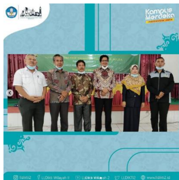
Gambar 3.1 Desain Frame foto

Penulis diberikan tugas untuk membuat desain frame foto kegiatan STIT, STIE, dan STIH Serasan Muara Enim untuk Sosialisasi Program Kerja dalam rangka Percepatan Jenjang Karir Dosen.