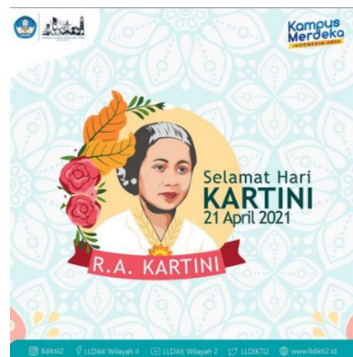
Gambar 3.5 Desain Hari Kartini

Penulis di tugaskan membuat desain untuk memperingati hari Kesehatan dunia dengan adanya unsur keadaan saat ini, yang dimana dunia sekarang tengah diguncang karena adanya wabah penyakit.