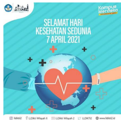
Gambar 3.3 Desain Hari Kesehatan Dunia

Penulis di tugaskan membuat desain untuk memperingati hari Kesehatan dunia dengan adanya unsur keadaan saat ini, yang dimana dunia sekarang tengah diguncang karena adanya wabah penyakit.