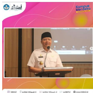
Gambar 3.13 Desain Frame kegiatan Seminar Nasional Ilmu Manajemen, Kepemimpinan, dan Organisasi (SIMKO)