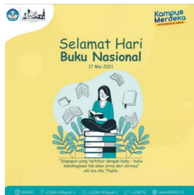
Gambar 3.8 Desain Hari Buku Nasional

Penulis diberikan tugas dari pembimbing lapangan membuat desain ucapan Selamat hari Buku Nasional yang di peringatkan pada tanggal 17 Mei 2021.