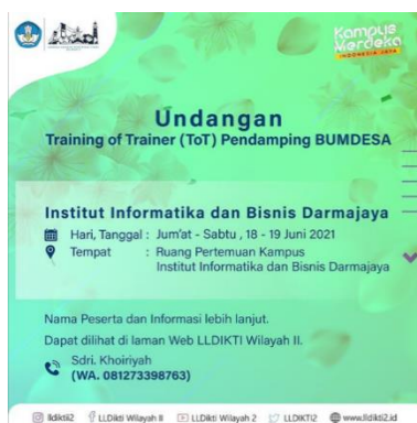
Gambar 3.12 Desain Undangan Training of Trainer

Penulis diberikan tugas dari pembimbing lapangan membuat desain Undangan Training of Trainer (ToT) Pendamping BUMDESA yang akan dilaksanakan Institut Informatika dan Bisnis Darmajaya, Pada tanggal 18 – 19 Juni 2021.