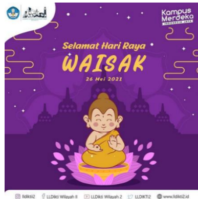
Gambar 3.10 Desain Hari Waisak

Penulis diberikan tugas dari pembimbing lapangan membuat desain ucapan Selamat hari Waisak yang di peringatkan pada tanggal 26 Mei 2021.