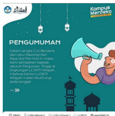
Gambar 3.6 Desain Hari Libur Lebaran

Penulis di tugaskan membuat desain Pengumuman cuti bersama dan Libur nasional hari Raya Idul Fitri 1442 H untuk menginformasikan bahwa Kantor LLDIKTI Libur/Tutup, Serta desain ucapan Selamat hari Raya Idul Fitri 1442 H.